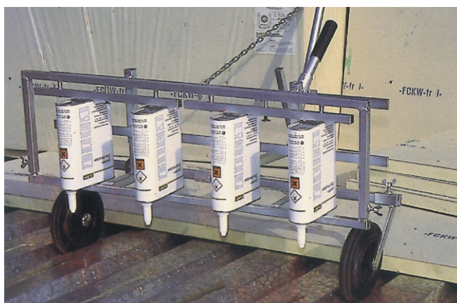
Die 2-kg-Gebinde können beispielsweise mit einem zeit- und arbeits-sparenden Auftragswagen verarbeitet werden.