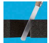
Leicht zu bearbeiten