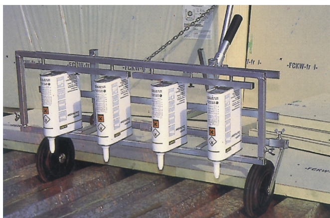
Die 2-kg-Gebinde können beispielsweise mit einem zeit- und arbeits-sparenden Auftragswagen verarbeitet werden.